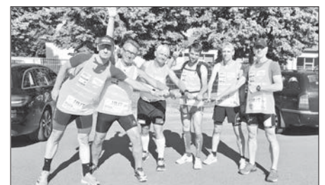
Die Laufgruppe startete im Auenstadion Flöha

Der Chef der Laufgruppe des TSV Falkenau wollte wie seine Mitstreiter auf dem Weg in die Kreisstadt eigentlich 28 Kilometer zurücklegen. „Ein Teil der Gruppe, zu der auch ich gehörte, hat sich aber verlaufen. So wurde die Distanz noch länger und unser Zielankunft in Freiberg verschob sich. Schließlich hatten wir gegen 21.30 Uhr den Obermarkt erreicht“, schmunzelte Schröder. „Aber davon abgesehen war es eine tolle Sache, die Strecke führte über Stock und Stein. Alle Beteiligten hatten ihren Spaß“, versicherte der Falkenauer. kbe