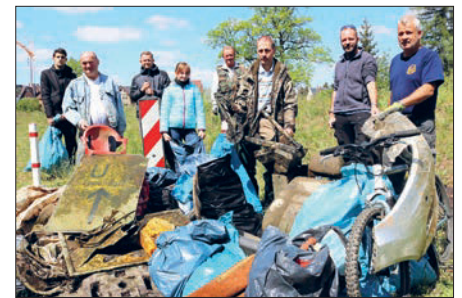
Mitglieder des Angelsportvereins Flöha zogen bei der diesjährigen Gewässerreinigungskampagne wieder viel Unrat aus Zschopau und Flöha.

Chemnitz. „Im Umfeld gibt es manchen Verein, der mangels geeigneter Bewerber für den Vorstand aufgelöst werden musste. Diesbezüglich sind wir gut aufgestellt“, sagte Meyer. kbe