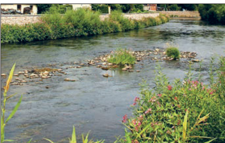
Auch ein Blick in die Zschopau zeigt, dass die Trockenheit der vergangenen Jahre ihre Spuren hinterlassen hat.

Die untere Wasserbehörde weist in der Verfügung zudem darauf hin, dass es verboten ist, ohne Erlaubnis Gewässer anzustauen. Das Schöpfen mit Handgefäßen im Rahmen des Gemeingebrauchs ist bei ausreichender Wasserführung weiterhin zulässig. Dies sollte jedoch mit höchster Zurückhaltung erfolgen. Auf keinen Fall dürfen dadurch das Gewässer und die Ufer sowie die Tier- und Pflanzenwelt beeinträchtigt werden.